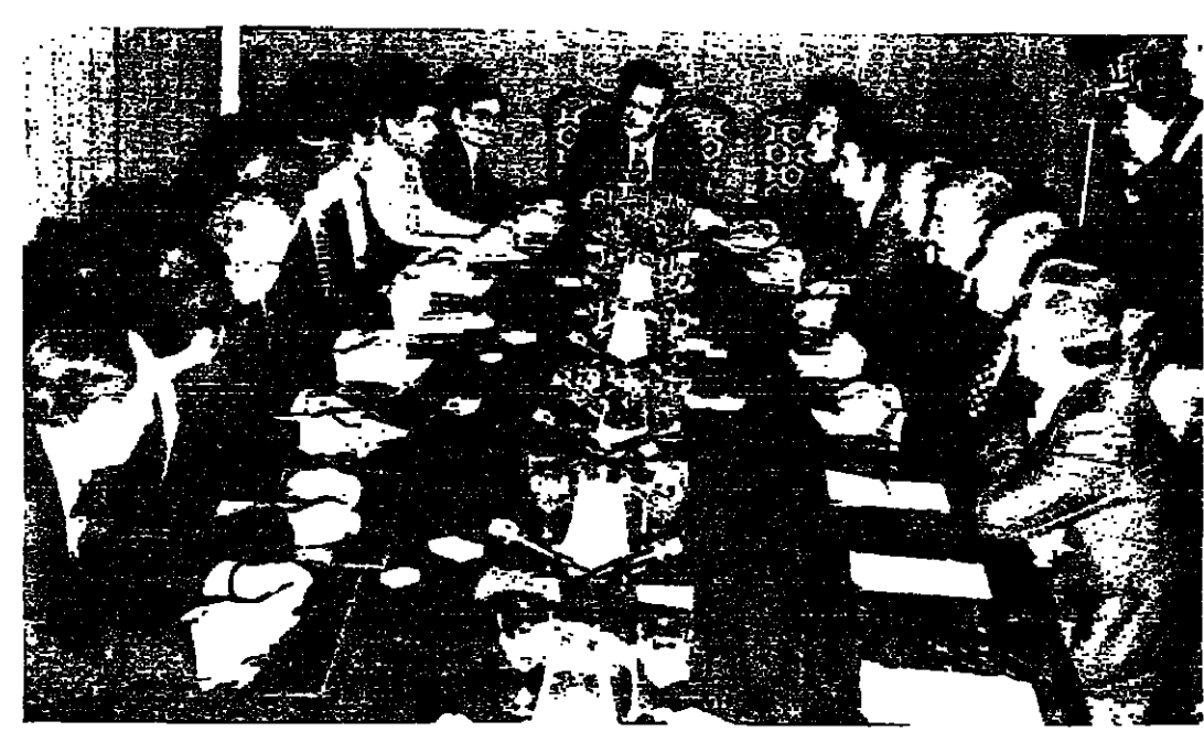
الرئيس الأسد لدى رؤيته اجتماع القيادة المركزية للجبهة القومية في دمشق مساء أمس الأول

معدت الجبهة اللبنانية اجتماعها الدوري مساء أمس في منزل الرئيس سليمان فزرجة بالقتل، واستمر الاجتماع من الساعة الخامسة والنصف حتى الساعة الثامنة والربع، وتبني عنه الإجماع شمل شمعون. ويعد الاجتماع قبال الرئيس شمعون: درسا ثلاثة أمور، أولا، وبالطبع الاجتماع الذي عقد في دمشق بين الرئيس الأسد والرئيس السادات وما يمكن أن تكون نتائجه، لأن الأزمات المعالية أمرته أهمية كبرى، وهذا شأن الله لا يحصل اختلاف. والثاني، الذي يتعلق بموضوع الجنوب، فحين نريد أن نتكلم عن الوجود الفلسطيني المسلح وطالما يبدو أن اللبنانيين على اختلاف آرائهم اتفقا على هذه النقطة، وهو أنه حسن للجنوب أن يتبنى من الفكر المصدق به. ويضاف: ثم أطلعنا على البيان الذي ألقاه أمين عام جامعة الدول العربية الطويل العريض، والذي تحدث فيه أكثر ما يكون عن لبنان، وشكره على اهتمامه فيما يخص لبنان، وأفضل أن ولو قليلا أن يوجه اهتمامه للزيارة التي سيقوم بها السادات لاسرائيل، وهذه مستحقة أكثر بكثير من هذا الاهتمام الزائد بلبنان. والموضوع الثالث الذي يطرحه هو موضوع الجامعة اللبنانية، فموضوع التعليم وتثبيت النهج الأمية حديثا، ونحن نخصي أول الاعتناء بالكفاية من أجل أن يكون لها القدرة لإيواء الطلاب، وخصوصا أربع مستوى